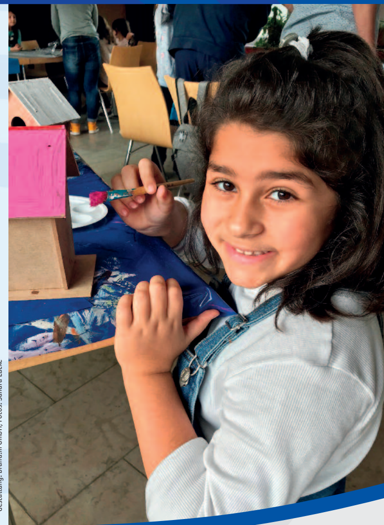
Gestaltung: brand.m GmbH

Programm für das 2. Schulhalbjahr 2022/23